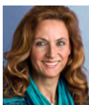
Ulrike Lubek Direktorin des Landschaftsverbandes Rheinland